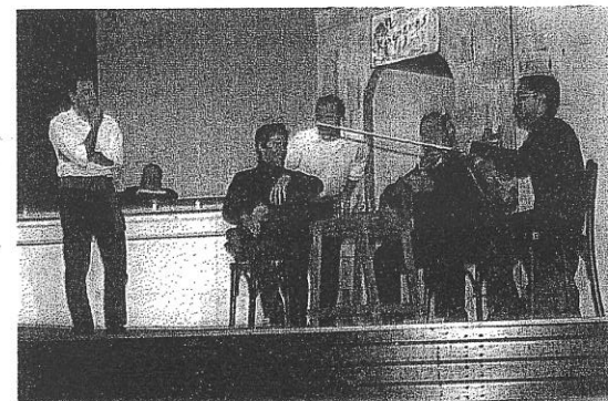
Στιγμιότυπο από την παράσταση Ελληνικού Θεάτρου του Wuppertal στο Schweningen